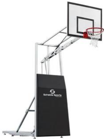
3x3 Street Slammers